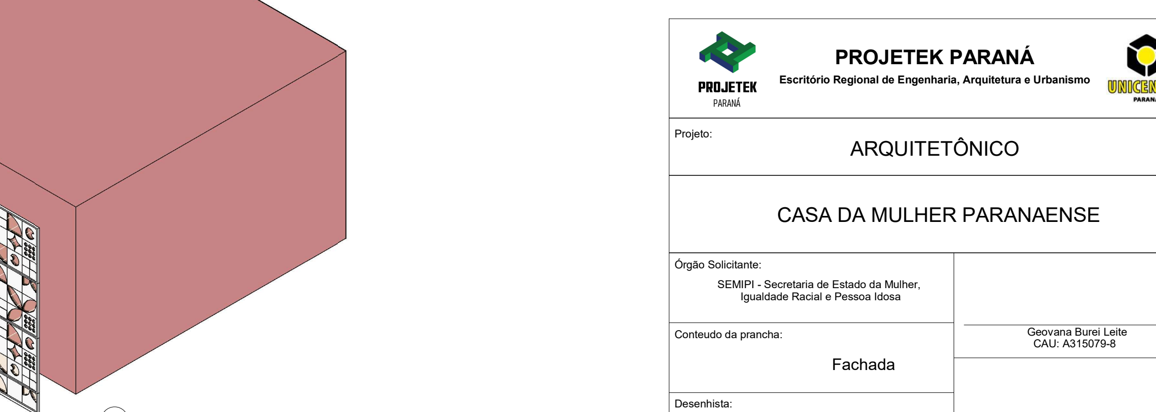
Revisão: R01 Escala: Prancha: